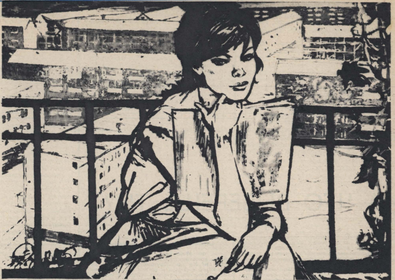
В. Петрова, Л. Петров. Из серии «Наши современницы». Офорт.

умеет — научится, зато образованный!» Сегодня в некоторых цехах Вологодского подшипникового вообще не встретишь рабочих без среднего образования. Так что уважительное отношение нужно заработать.