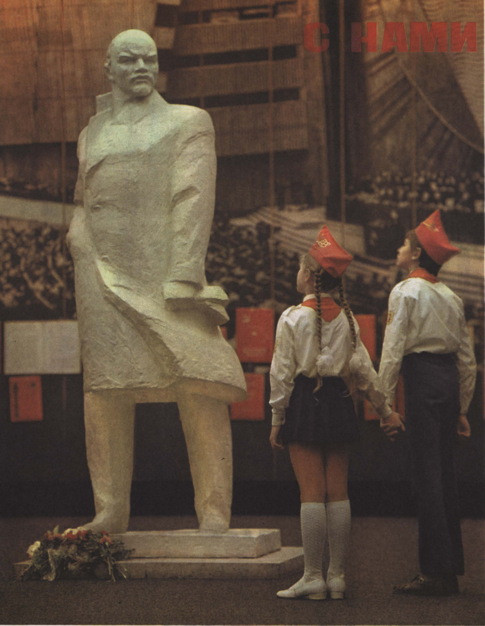
В Центральном музее В. И. Ленина.