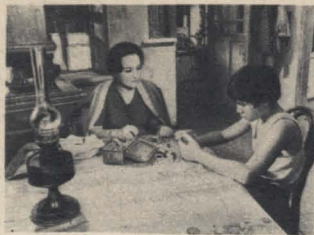
На снимке: А. Шенгелая в новом фильме.