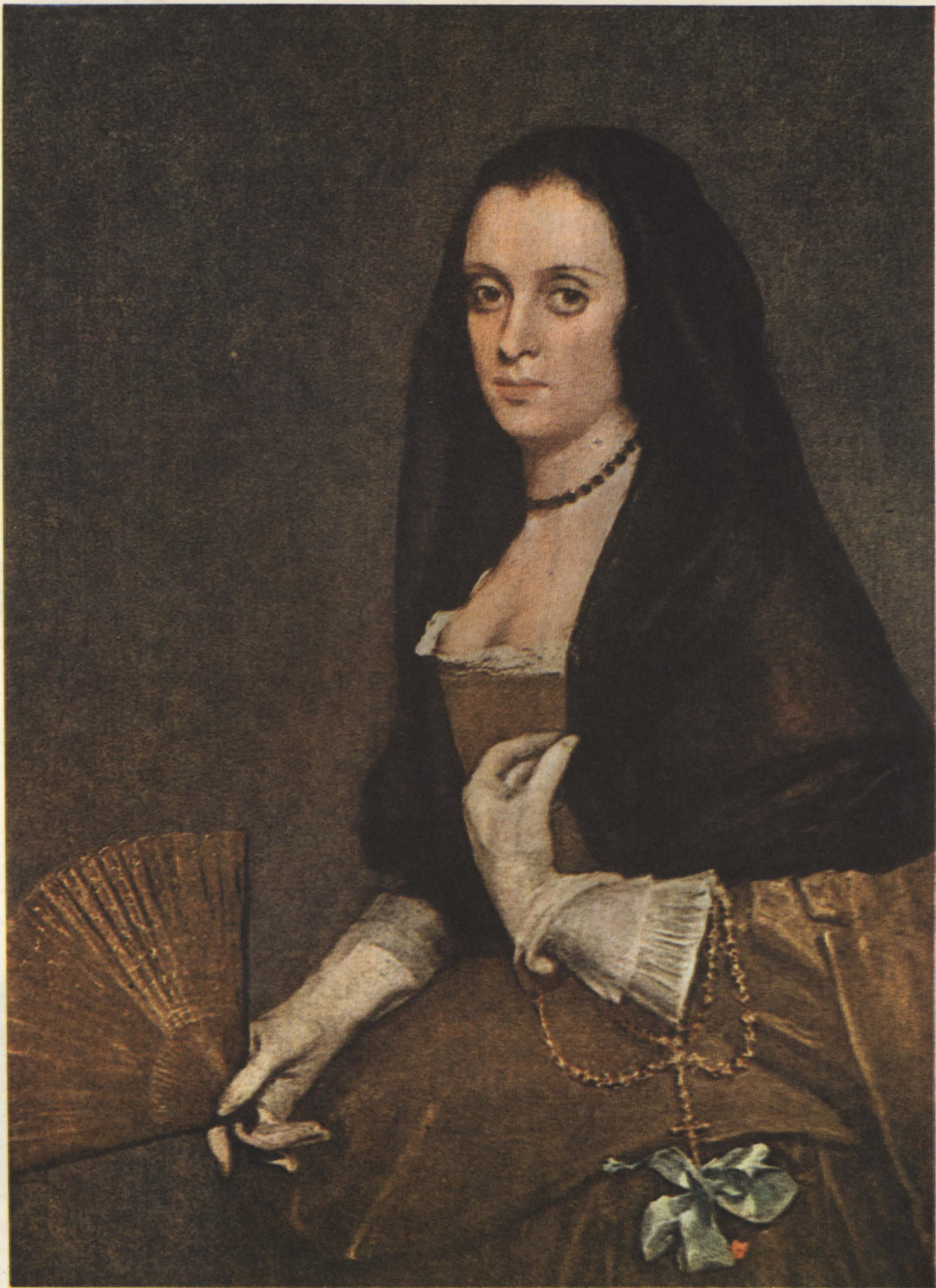
ДИЕГО ВЕЛАСКЕС. ДАМА С ВЕЕРОМ.