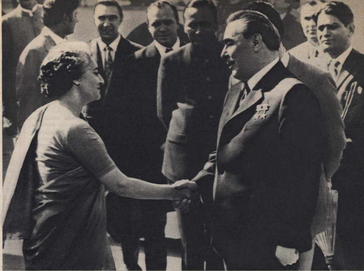
Леонид Ильич Брежнев прощается с Индирой Ганди на аэродроме Палам.